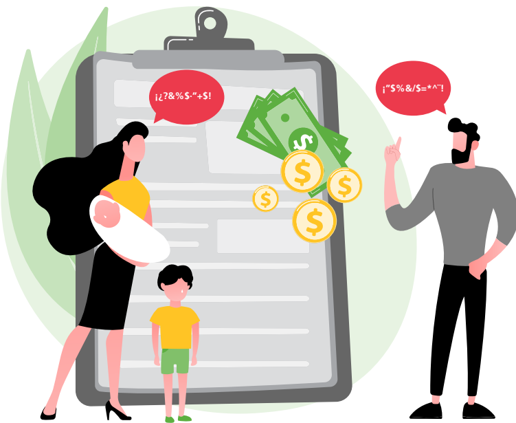
Ilustración: www.freepick.es/@vectorjuice .