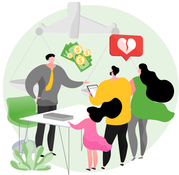
Ilustración: www.freepick.es/@vectorjuice .

Tratándose de alimentos, se pretende en el nuevo Código acortar de manera considerable los tiempos para la fijación de pensiones alimenticias a favor de los menores y en su caso del cónyuge que la requiera, ya que establece que la autoridad jurisdiccional dictará el auto admisorio a más tardar el día siguiente en que haya recibido el escrito respectivo y dará aviso sin demora a la persona física o moral de quien reciba el ingreso la persona deudora alimentista para que lleve a cabo